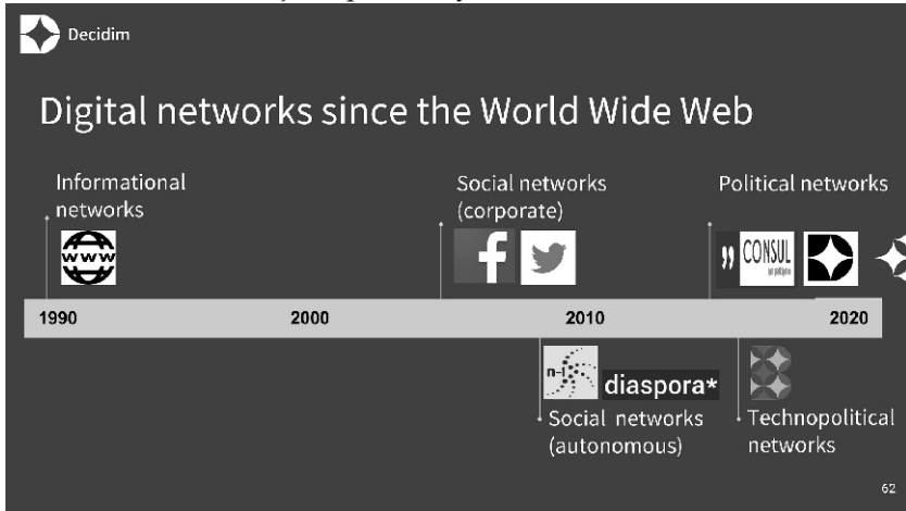
Immagine: Tre generazioni di reti digitali: dal WWW a Metadecidim Autore: Antonio Calleja-Lopez, cc-by-sa

Ad ogni modo, la chiave differenziale delle reti politiche risiede in ciò che si può fare in queste e con queste. Reti come Decidim hanno tre caratteristiche fondamentali: in primo luogo, riducono la centralità della figura del prosumer in rete (qualcuno che produce contenuti mentre li consuma, come anticipato da Toffler 18 ) e la sostituiscono con un attore decisamente politico; in secondo luogo, queste reti articolano spazi che permettono la costruzione di intelligenza, volontà ed azione collettiva oltre la mera espressione, aggregazione o circolazione dei gusti e delle preferenze individuali; in terzo luogo, connettono queste con decisioni che investono il piano collettivo in quanto tale.